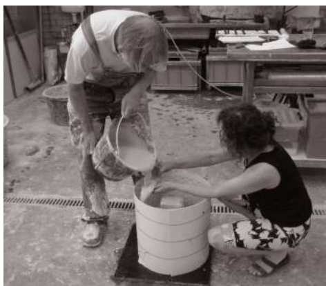
Alla Fonderia Beeldenstorm in Eindhoven, luglio 2012