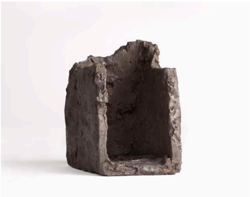
Past-Present , 2010 bronzo, 16.5 x 11 x 15 cm