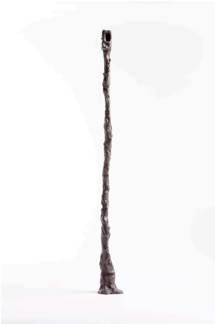
Vedetta , 2009 bronzo, 53 x 6 x 5 cm