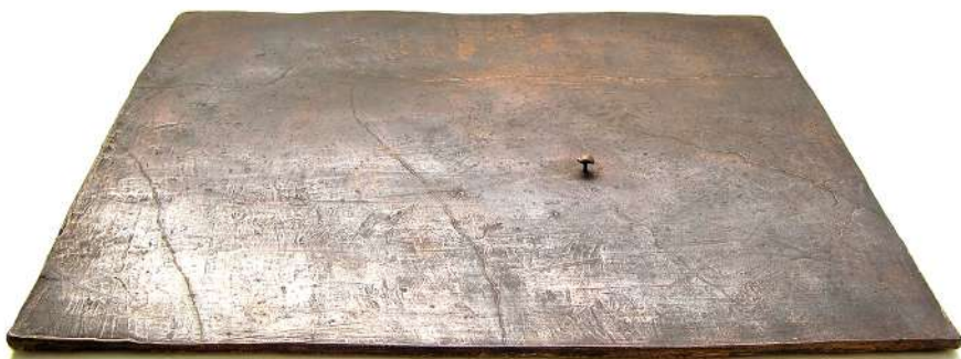
Una Estate , 1995 bronzo, 1 x 33 x 28 cm